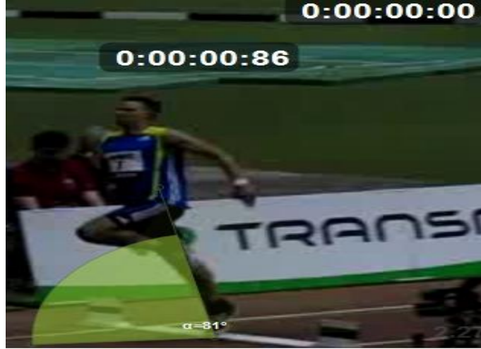
شكل ( ١ ) قياس زاوية الدفع