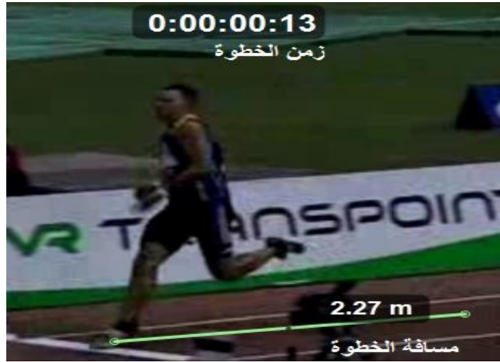
شكل ( ٢ ) قياس مسافة وزمن الخطوة الأخيرة

تم قياس مسافة الخطوة الأخيرة(المسافة بين قدم رجل اليمين في الخطوة الأخيرة و قدم رجل اليسار عند وضعها على اللوحة) وقياس الزمن المستغرق فيها، ومن ثم تقسيم المسافة على الزمن.(من خلال التحليل مباشرة) الشكل ( ٢ )